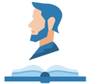
ਸੈ-ਜੀਵਨੀ (Life Story)