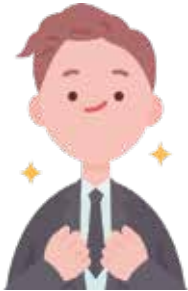
ਸੈ-ਮਾਨ (Self - Respect)