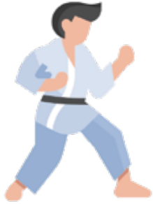
ਸੈ-ਰੱਖਿਆ (Self - Defence)